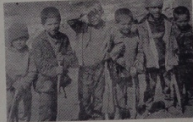
(Baştarafı Sayfa 4'de)